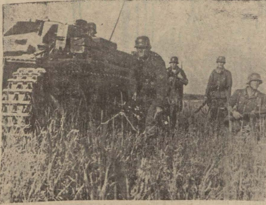
Şark cephesinde tanklar himayesinde ilerleyen Alman piyadesi

Ekmek karneleri vaktinde geliği takdirde bu ayın 20 sin- den sonra halk dağıtma birlik- leri tarafından evlere dağıtıl- acaktır.