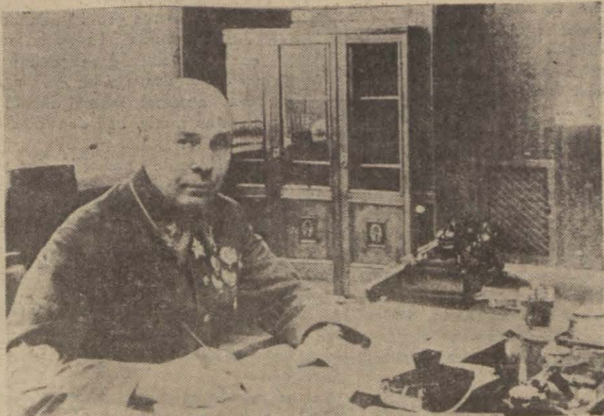
Mareşal Timoçenko mesai odasına

1 — Şark cephesinde: Stalingrad ile büyük Don kavş- arısında hergün daha güç bir du- ruma düştüğünü bundan evvelki yazımızda kayıd ve işaret etmiş (Devamı 5 inci sayfada)